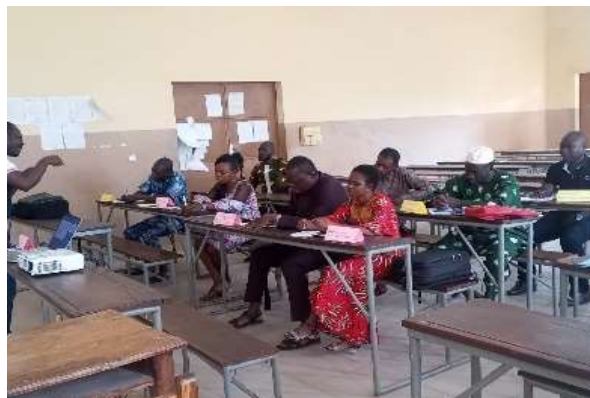
Séance de formation de la plateforme sur l'IL, le DPI et autres