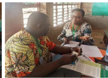
Le Chef service nutrition de la mairie de Bembéréké s'exprimant sur la formation