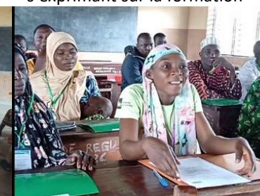
Intervention d'une participante à la formation la formation de Badékparou