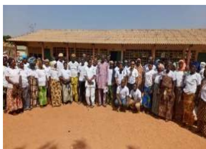
Photo de famille de la foire