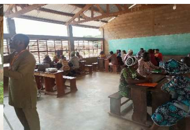
Travaux de groupe au cours de la formation