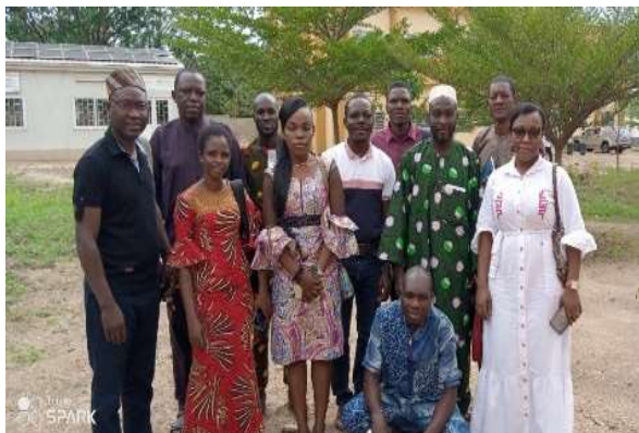
Photo de famille de la rencontre de présentation du projet ELI-FANS à la plateforme nationale