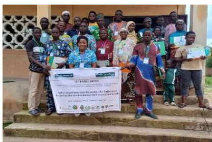
Photo de famille de la formation de Badékparou