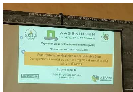
Séance de restitution de la formation à la plateforme nationale Prolinnova-Bénin