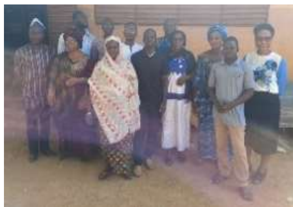
PML de Bembéréké