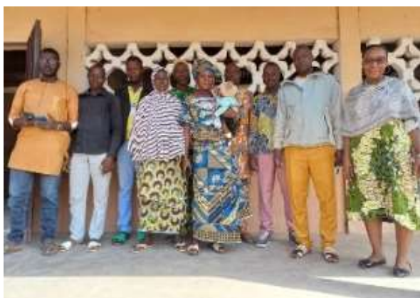
PML de Tchaourou