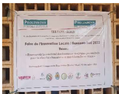
Banderole de la foire