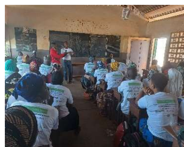
Cérémonie de lancement de la foire