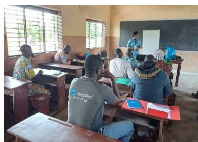
Présentation du projet ELI-FANS au cours de la rencontre de Badékparou