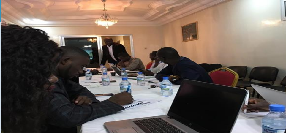
Samedi 11 janvier 2020, ONG Agrecol Afrique