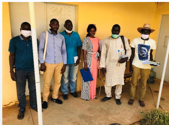
Délégation SAED Podor