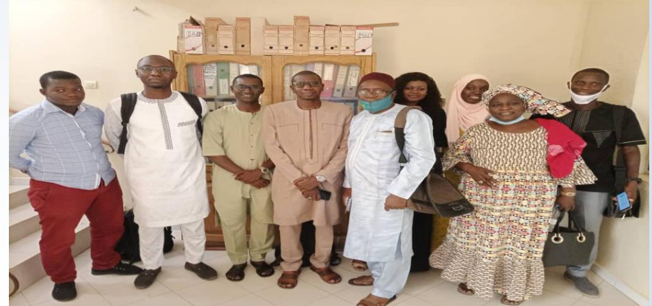
Vendredi 17 juillet 2020, ONG Agrecol Afrique

➤ Socialisation du projet: 08 organisations visitées (FPA, Délégation SAED Dagana, Délégation SAED Podor, UJAK, AFUP, UGPAR, ONG Andando, ASSESCAV).